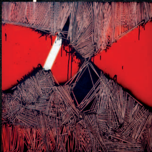
SOTTO: L' ALFABETO SENZA FINE - 1974 OLIO SU TELA CM 60X60

dal 17 Febbraio fino al 14 aprile presso la Galleria Dep Art (via Giuriati, 9 - Milano Tel/Fax +39 02 36535620 - Email: art@depart.it -Orario: Martedì - Sabato 15 / 19 - Mattina e Festivi su appuntamento; per informazioni contattare il direttore Antonio Addamiano cell. + 39 335 1998212). L'esposizione sarà presentata in anteprima ad Arte Fiera Bologna, dal 26 al 30 gennaio 2012 in uno stand monografico (pad 16 stand C2).